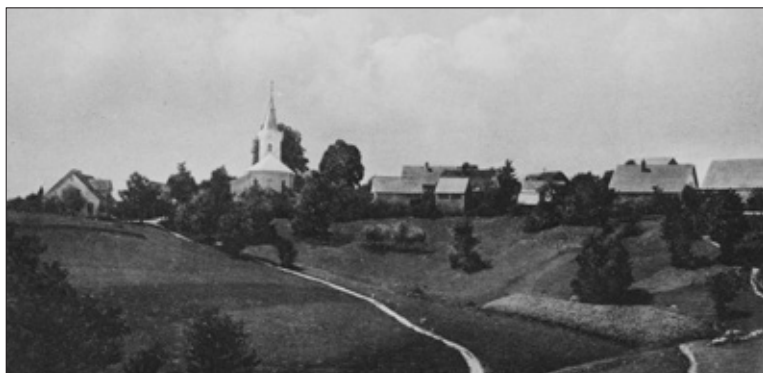
Sv. Vid leta 1930.